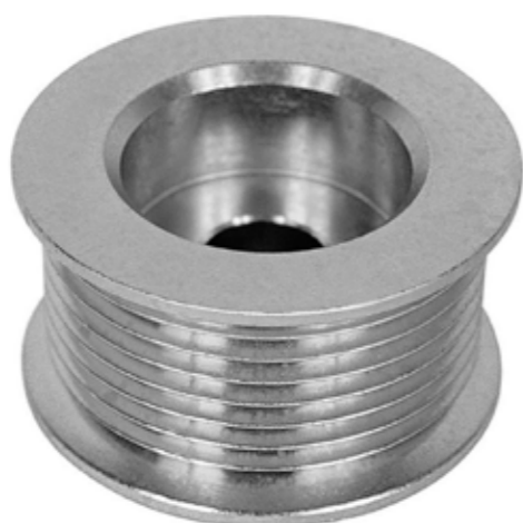
DETALHE DA DISTÂNCIA DO EIXO