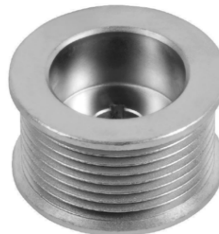
DETALHE DA DISTÂNCIA DO EIXO